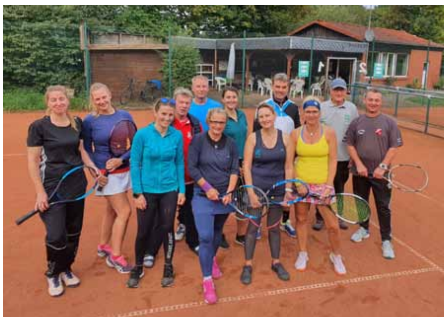
Abschluss-Kuddelmuddel 2021 mit Gästen

Hier nebensächlich nochmal die offizielle Einladung. Bitte den Termin im Kalender notieren!